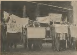
WELGA DI PAN NA SCHIEDAM

Ta Bende Un Lessenaar di fl. 50.- Un Lessenaar di Metal fl. 175.- Pa informacion: Tel. 2151